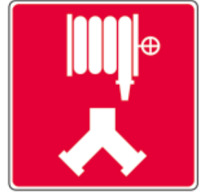
Raccords-pompiers pour les cabinets d'incendie