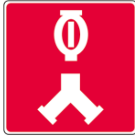
Raccords-pompiers pour le réseau de gicleurs