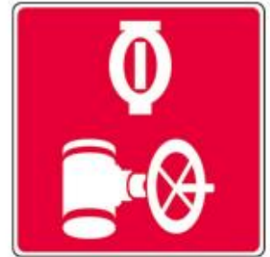
Valve du réseau de gicleurs