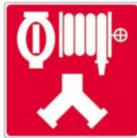
Raccords-pompiers pour le réseau de gicleurs et les cabinets d'incendie