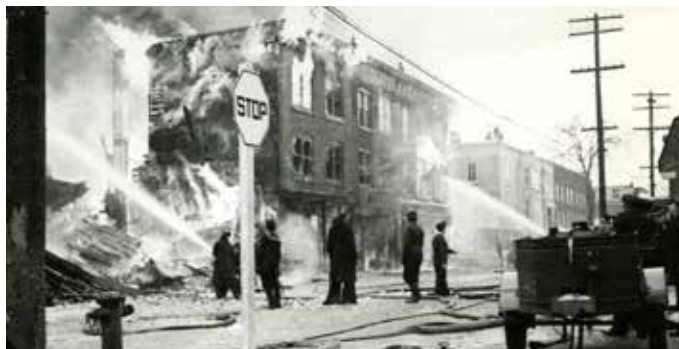
Photo : Incendie sur la rue Cascades en 1944.

Mardi au jeudi : 13 h à 17 h Samedi : consultez le site Internet 450 261.9722