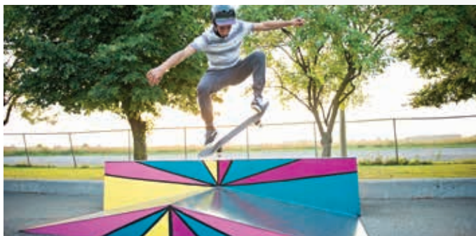
PLANCHE À ROULETTES

Profitez-en aussi pour compléter votre entraînement avec une séance tonifiante sur le module d'entraînement situé au parc du Bois des Pins et au parc de La Survivance. Une affiche sur place vous propose des exercices adaptés à tous.