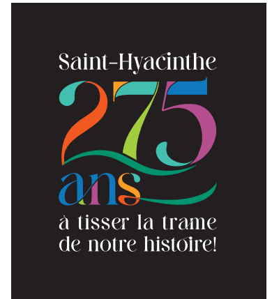
Logo couleurs renversé